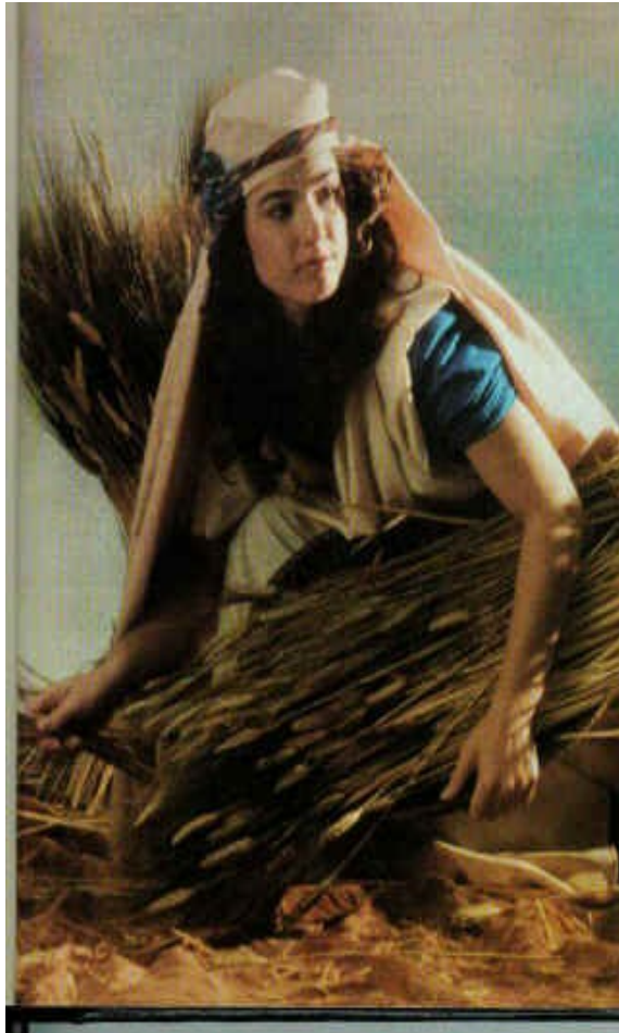
Une approche du Livre de Ruth pour notre temps